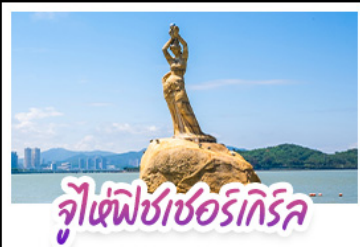
จูเซ่ฟิซเซอร์ทริค