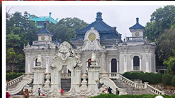
พระราชวังเซวานเหมิงเซวานไห่เหม่