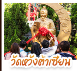
วัดเซว้งต้าเซียง