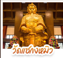
วัดเชกงเมว