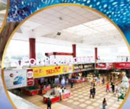
ตลาดกังเป๋ย