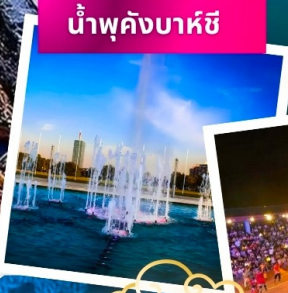
น้ำพุคังบาศี