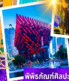
พิพิธภัณฑ์ศิลปะ ฉงชิ่ง