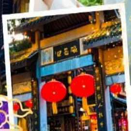
หมู่บ้านโบราณฉือซีเซ่