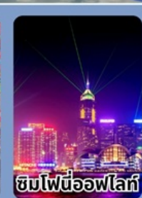
ชมไฟนีออนฟลาร์

ราคาเที่ยวเที่ยวเกินคุ้ม 12,999 บาท/ท่าน