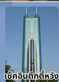
เขื่อนฉินติ๊กตีห้วง