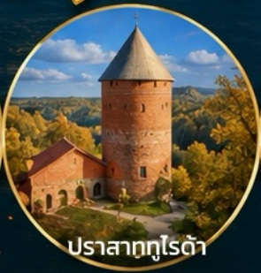
ปราสาทกูโรต้า