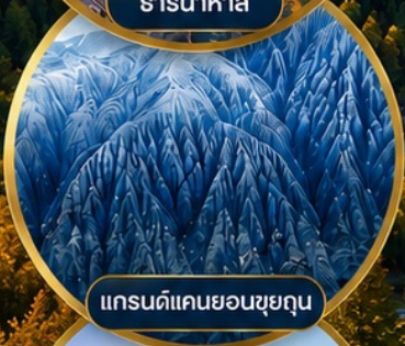
แกรนด์แคนยอนซูยกุน