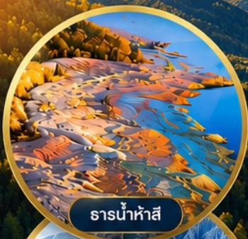
ธารน้ำห่าสี