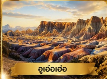
อุหล่อฮ่อ