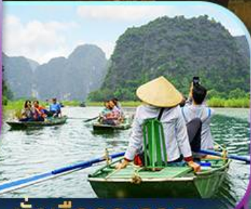
นั่งเรือกระจาด