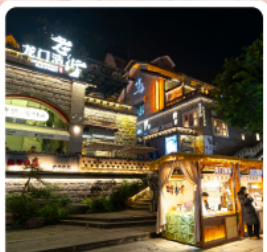
ตลาดโบราณหลงเหมินฮ่าว