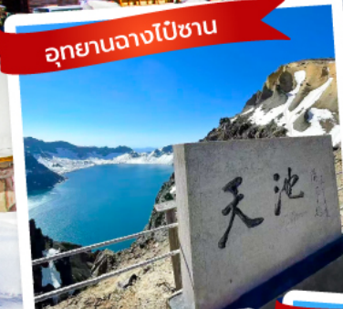
อุทยานแห่งชาติฉางไบ่ซาน