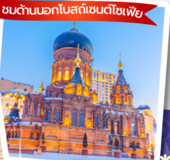
ชมด้านนอกโบสถ์เซนต์โซเฟีย