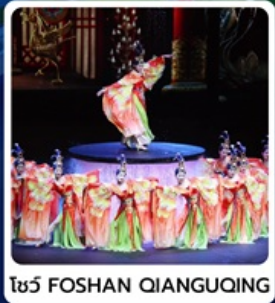
โชว์ FOSHAN QIANGQING