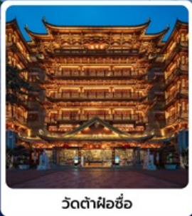
วัดต้าฝื่อซื่อ