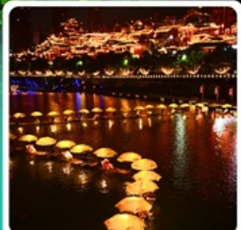
เมืองเซียนเจิน