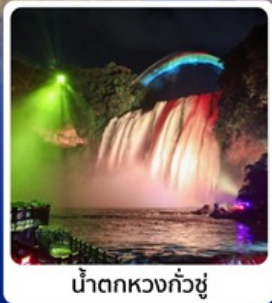
น้ำตกหวงกั๋วซู