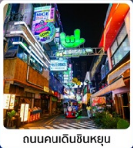
ถนนคนเดินซินหยุน