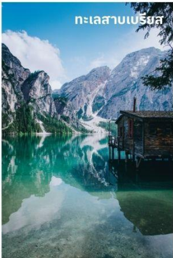
ทะเลสาบเบรียส

บริการอาหารกลางวัน ณ ภัตตาคาร นำท่านเดินทางสู่ ทะเลสาบเบรียส (Lake Braies) หรือ (Pragser Wildsee) ใช้เวลาเดินทางประมาณ 40 นาที เป็นทะเลสาบที่ได้ขึ้นชื่อว่าไข่มุกแห่งโดโลไมท์ ตั้งอยู่ในหุบเขาโดโลไมท์และยังได้เป็นส่วนหนึ่งในมรดกโลก (Unesco) อีกด้วย