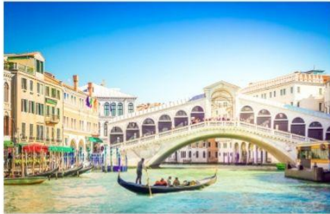
สะพานริอัลโต