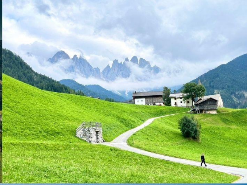
Santa Maddalena - Val di Funes