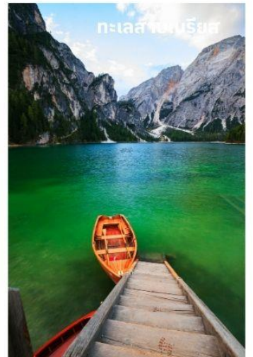
ทะเลสาบเบรียส