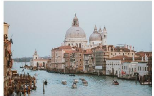
แกรนด์คาแนล

นำทุกท่านนั่งเรือต่อเพื่อไปยัง ท่าเรือซานมาร์โค (San Marco Pier) บนเกาะเวนิส แวะให้ท่านถ่ายรูปสวยๆ เก็บเป็นที่ระลึกกันที่ พระราชวังดอดจ์ พระราชวังริมน้ำแสนอลังการ ที่สร้างตั้งแต่ศตวรรษที่ 14 ในสไตล์เวเนเซียนโกธิค ที่เคยเป็นที่ประทับของผู้ปกครองของเวนิส แต่ตั้งแต่ปี 1923 ก็ได้เปลี่ยนเป็นพิพิธภัณฑ์ให้คนทั่วไปได้เข้าชม เป็นหนึ่งในแลนด์มาร์คหลักของเวนิส จากนั้นเดินเที่ยวชมแลนด์มาร์คสำคัญต่างๆ ในเมือง จัตุรัสเซนต์มาร์ค เป็นจัตุรัสหลักของเมืองเวนิส และยังเป็นศูนย์กลางเมืองตั้งแต่โบราณ จากนั้นนำท่านถ่ายรูปกับ มหาวิหารเซนต์มาร์ค มหาวิหารใหญ่ ของศาสนาคริสต์นิกายโรมันคาทอลิก อลังการด้วยการตกแต่งด้วยโดมใหญ่ และที่อยู่ติดกันและโดดเด่นด้วยความสูงถึง 50 เมตรก็คือ หอรบั้ง ถือเป็นหนึ่งในสัญลักษณ์ของเมืองที่ เห็นได้ไม่ว่าจะอยู่มุมไหนของเมืองก็ตาม และที่พลาดไม่ได้เลยก็คือ สะพานถอนหายใจ สะพานอันโด่งดังแห่งนี้ตั้งอยู่เหนือแม่น้ำที่คั่นกลางระหว่างคูเก่าแก่กับพระราชวังดอดจ์