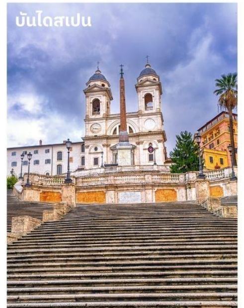
บันไดสเปน