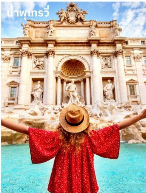
น้ำพุเทรวี่

จากนั้นนำท่านถ่ายรูปด้านหน้าของ สนามกีฬาโคลอสเซียม (Colosseum) เป็น 1 ใน 7 สิ่งมหัศจรรย์ของโลกยุคโบราณ ในอดีตนั้นเป็นสนามประลองการต่อสู้ที่ยิ่งใหญ่ของชาวโรมันที่สามารถจุผู้ชมได้ถึง 50,000 คน จากนั้นนำท่านชมงานประติมากรรมของเทพนิยายกรีกและโยนเหรียญลูอิซฐานบริเวณ น้ำพุเทรวี่ (Trevi Fountain) สัญลักษณ์ของกรุงโรมที่โด่งดัง จากนั้นอิสระตามอัธยาศัยกับการเลือกซื้อสินค้าแฟชั่นและของที่ระลึกในบริเวณย่าน บันไดสเปน (The Spanish Step) ซึ่งเป็นแหล่งแฟชั่นชั้นนำสุดหรูและยังเป็นแหล่งนัดพบของชาวอิตาลี