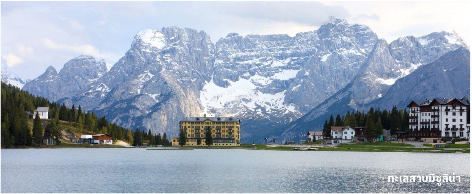
ทะเลสาบมิซูลิน่า

นำท่านเดินทางสู่ที่ ทะเลสาบมิซูลิน่า (MISURINA LAKE) ถ่ายรูปกับทะเลสาบที่สวยงามและเป็นเหมือนกับหนึ่งในแลนด์มาร์คที่นักท่องเที่ยวต้องมาเยือนสักครั้งหนึ่ง เป็นทะเลสาบที่หลบซ่อนตัวในหุบเขา ที่ถือเป็นสถานที่ท่องเที่ยวที่สำคัญอีกแห่งในโดโลไมท์