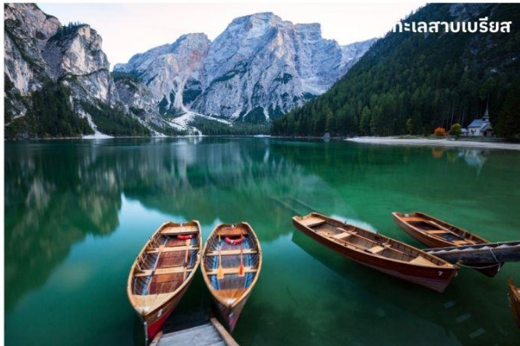
ทะเลสาบเบรียส