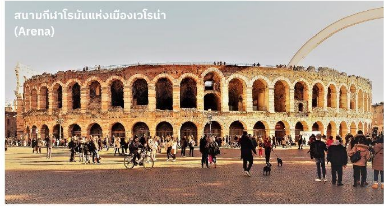
สนามกีฬาโรมันแห่งเมืองเวโรน่า (Arena)