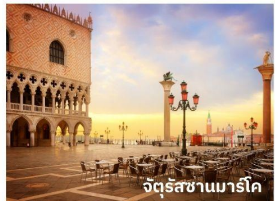
จัตุรัสซานมาร์โค

ท่านสามารถทำการสแกน QR CODE นี้ เพื่อรับชม เกาะเวนิส ในรูปแบบวิดีโอ