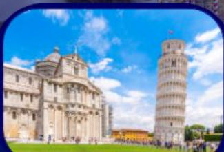
หอเอนแห่งเมืองปิซ่า