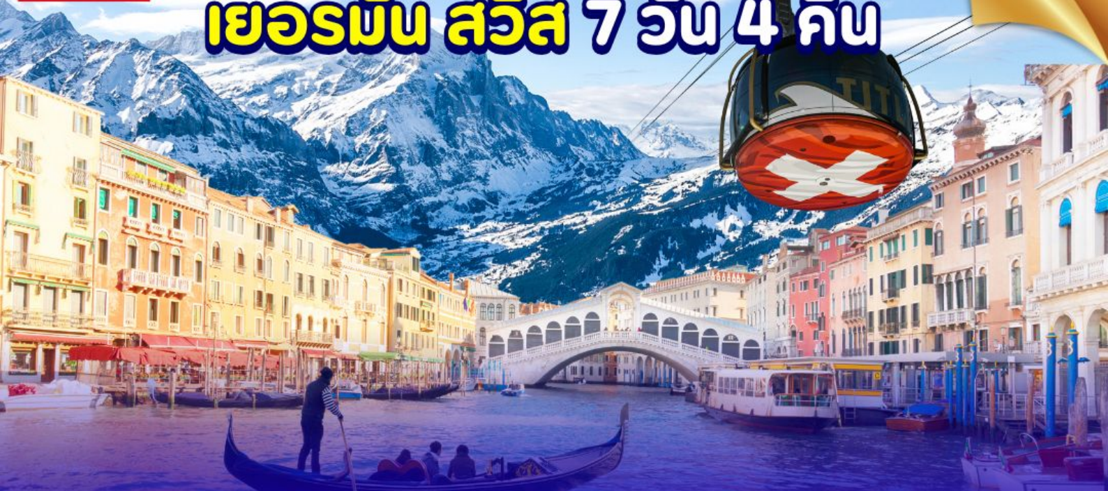
ยอดเขากิตลิส