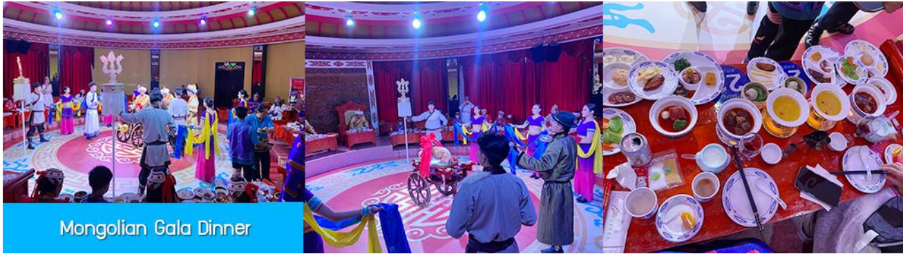
Mongolian Gala Dinner