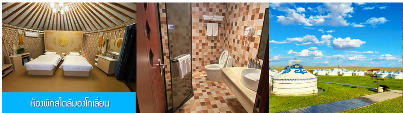
ห้องพักสไตล์มองโกลลิ้น