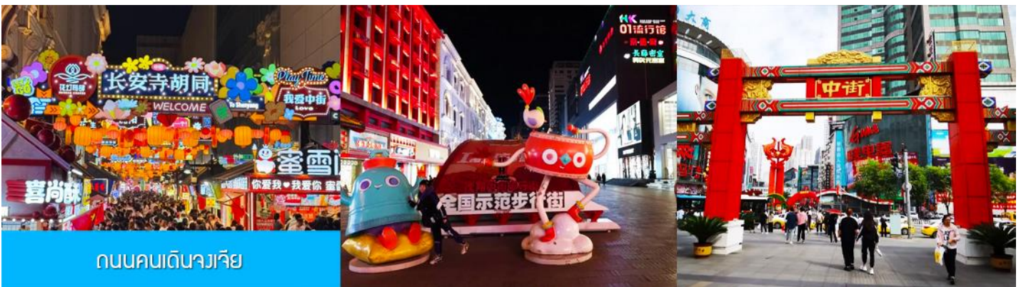
ถนนคนเดินจวงเจีย