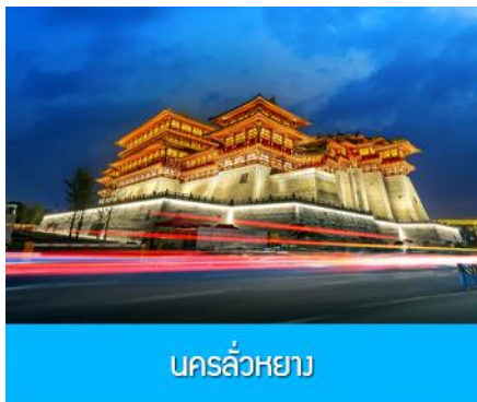
นครลั่วหยาง