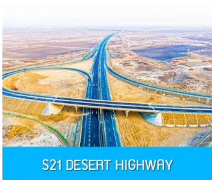
S21 DESERT HIGHWAY