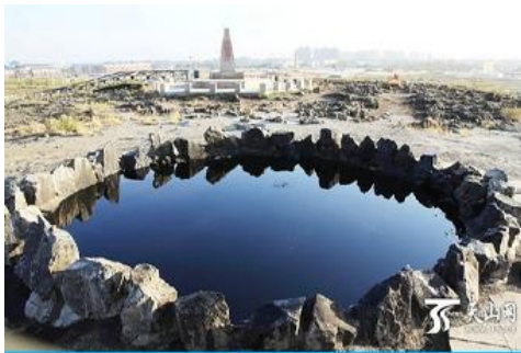
บ่อน้ำมันสีดำ