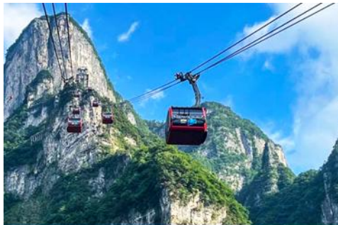
กระเช้าขึ้นเขาเทียนเหมินซาน

พักที่ HANTING HOTEL ระดับ 4 ดาวท้องถิ่นหรือเทียบเท่าในเมืองจางเจี๋ยเจี๋ย