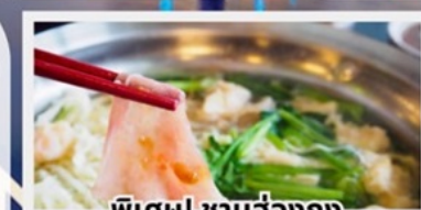
พิเศษ! ชาบูฮ่องกง