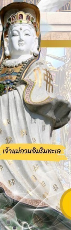
เจ้าแม่กวนอิมวิมทะเล