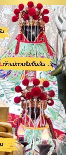
เจ้าแม่กวนอิมยืมเงิน