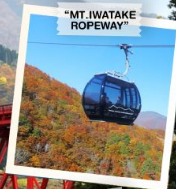
"MT. IWATAKE ROPEWAY"