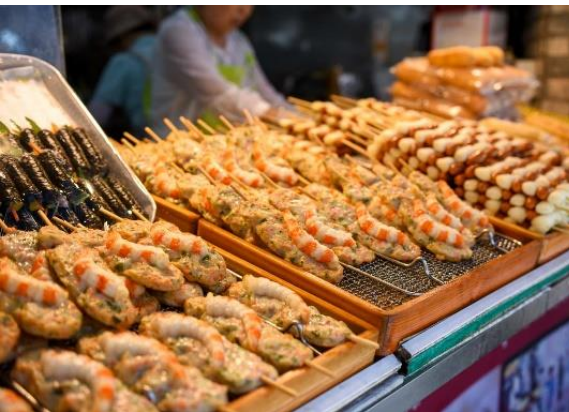
เที่ยวเพลิน แคมอ้มท้อง

ให้ท่านอิสระ ที่ตลาดแฮอินแด แหล่งช้อปปิ้ง สุดฮิต เกาหลี เกาหลี เป็นตลาดแห่งเดียวของเกาหลีใต้ที่ตั้งอยู่ใกล้ชายหาดแฮอินแด ซึ่งถือว่าเป็นชายหาดที่มีชื่อเสียงมากที่สุดในประเทศเกาหลีใต้ เพราะชาวเกาหลีนิยมมาเที่ยวในฤดูร้อน เป็นถนนสายเล็กๆ มีร้านอาหารเปิดขายของตั้งแต่เช้าจนถึงช่วงดึก ตลาดแห่งนี้ยิ่งดึกยิ่งคึกคัก นักท่องเที่ยวนิยมไปเดินชิว ภายในตลาดมีความสะอาดอ่าน มีร้านค้าพร้อมป้ายสัญลักษณ์ที่มีมาตรฐาน มีร้านจำหน่ายอาหารพื้นบ้านให้ได้ลิ้มลอง รสชาติ มีร้านค้าที่จำหน่ายผลิตภัณฑ์ที่หลากหลาย แปลกตา แล้วก็ต้องมีร้านอาหารทะเลสดๆ เพราะใกล้แหล่ง มีแผงขายอาหารแบบสตรีทฟู้ด ร้านอาหารให้เลือกรับ และร้านค้าจำหน่ายขนมของฝากท้องถิ่น เรียกได้ว่า เดิน