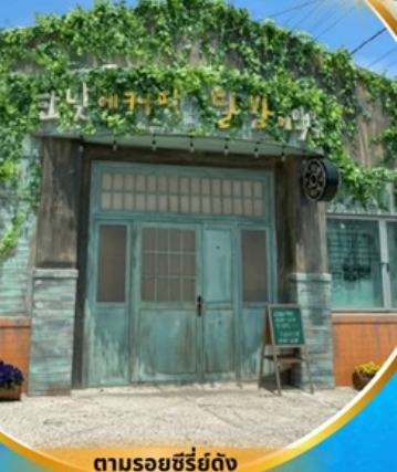
ตามรอยซีรีส์ดัง Hometown chachacha

โพล้งสเปซวอล์ค สกายจอร์ค ตามรอยซีรีส์ Hometown chachacha ถ่ายรูปชิคๆ หมู่บ้านวัฒนธรรมคัมซอน ขึ้นเคเบิลคาร์ ชมทะเลปูซาน นั่งรถไฟปิ๊กปิ๊ก sky capsule ชิมของอร่อยตลาดแฮนแด อิสระช้อปปิ้ง Lotte Duty Free