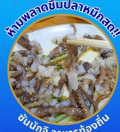
ห้ามพลาดชิมปลาหมึกสด!