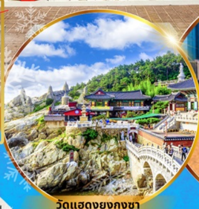
วัดแสดงยงกุงซา