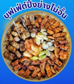
บุฟเฟ่ต์ปิ้งย่างไม่อั้น