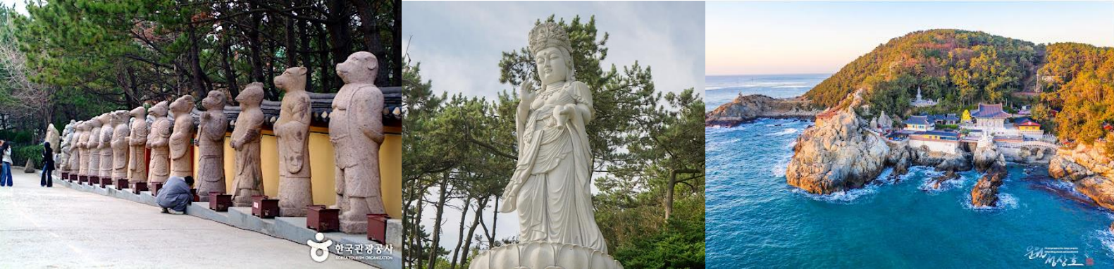
หินและมีท้องทะเลกว้างเป็นฉาก

พาทุกท่านเดินทางถึง วัดแฮดงยงกุงซา ตั้งอยู่บนชายฝั่งตะวันออกเฉียงเหนือของเมืองปูซานเป็นวัดที่สร้างบนเหล่าโขดหินริมชายหาดที่แตกต่างไปจากวัดส่วนใหญ่ซึ่งมักจะสร้างอยู่ตามเชิงเขา วัดแห่งนี้ก่อตั้งโดยพระผู้ยิ่งใหญ่ซึ่งมีนามว่าพระนางอชฺชโตชาซึ่งเป็นทีปรีษาของกษัตริย์คิมมินวังแห่งโครยอเมื่อทุกท่านเดินเท้าเข้าสู่วัดแห่งนี้จากประตูซุ้มมังกรสีทองอร่ามเดินผ่านอุโมงค์ขนาดเล็กไปสู่บันไดหิน 108 ขั้นและโคมไฟหินซึ่งเป็นจุดสำหรับชมวิวและความงดงามของท้องทะเลสีฟ้าครามก่อนจะเดินต่อไปสู่บริเวณซึ่งเป็นที่ประดิษฐานของพระพุทธรูปศักดิ์สิทธิ์องค์สำคัญซึ่งตั้งตระหง่านอยู่บนโขด