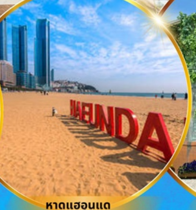
หาดแฮนแด