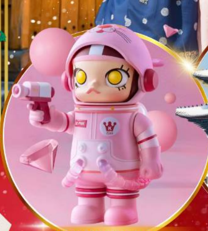
POP MART ฮงแด