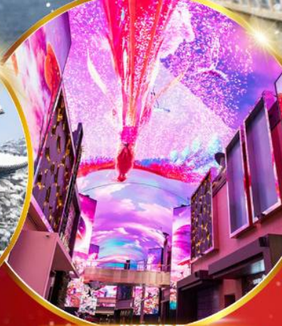
INSPIRE Entertainment Resort

ชมจอ LED ขนาดยักษ์ที่รีสอร์ท 5 ดาว ใหญ่ที่สุดในเอเชียเหนือ ชมพระราชวังคยองบกคุง เยือนอดีตหมู่บ้านบุคซอน ฮงอก ใส่ชุดฮันบก ทำข้าวห่อสาหร่าย อิสระช้อปปิ้ง Lotte Duty Free