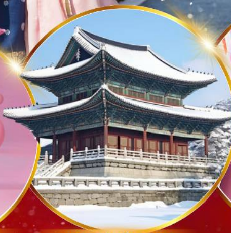
พระราชวังเคียงบกคุง