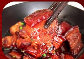
พิเศษ!! หมูสามชั้นน้ำแดง