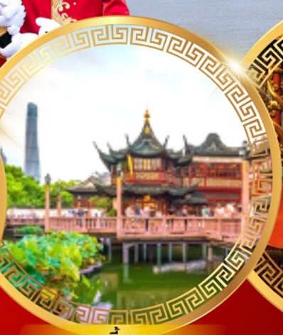
สวนอีหวน