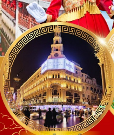
ถนนคนเดินหนานจิง

เดอะบรันด์ หาดไต้หวัน ขึ้นหอไข่มุก อิสระ เชียงใหม่ ดิสนีย์แลนด์ วัดหลงหัว อายุมากกว่า 1700 ปี สักการะวัดพระหยกขาว สวนอีหวนกว่า 400 ปี สตาร์บัค ใหญ่ที่สุดในเอเชีย ช้อปปิ้งถนนโบราณชื่อดัง