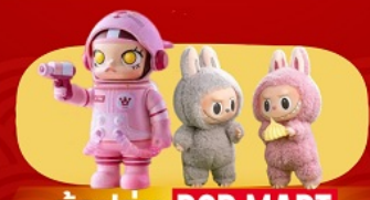
ช้อปปิ้ง POP MART