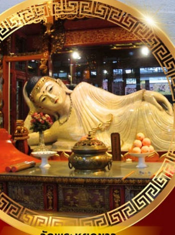
วัดพระหยกขาว