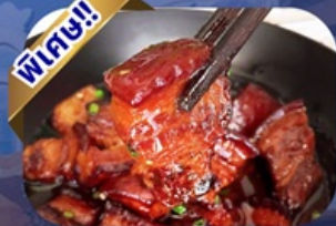
พิเศษ!! เมนูหมูสามชั้นตุ๋นน้ำแดง

พักโรงแรม 4 ดาว ★★★★★ ฟรี ประกันอุบัติเหตุ บริการ อาหารท้องถิ่น