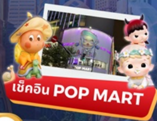
เชคอิน POP MART