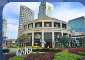
สตาร์บิคใหญ่ที่สุดในเอเชีย