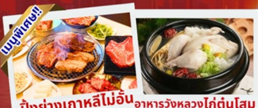
ปิ้งย่างเกาหลีไม่อื่น อาหารวังหลวงไก่ตุ๋นโสม