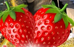
มีผลตอบเอบอด้สุด ๆ จากรั้