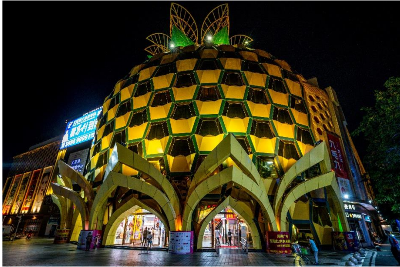
(อิสระอาหารค่ำ)

นำท่าน ช้อปปิ้งห้างสรรพสินค้า ตั้งอยู่ย่านธุรกิจ Dadonghai ซานย่า ซึ่งมีวิวระดับ 4A ติวอาคารมีรูปร่างเป็นฉับปะรดสีทอง ขนาดใหญ่ ภายมีร้านค้าต่างๆมากมาย บริเวณห้างยังมีที่สามารถจัดงานเลี้ยง สัมมนา พักผ่อน และความบันเทิง