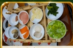
ซินมินข้ามสะพาน