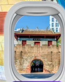
เมืองโบราณหนานโกว