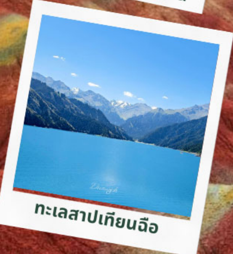
ทะเลสาปเทียนจื่อ