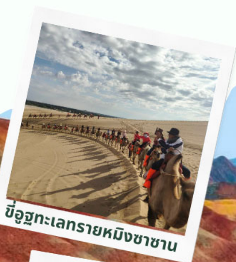
ขบวนคาราวานอูฐทะเลทรายหมิงซาซาน