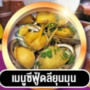
เมนูซีฟู้ดลิ้นมดุน