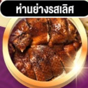
ห่านย่างรสเลิศ