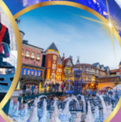
โรงงานช็อคโกแลต ชิโรอิ โคอิมีโตะ