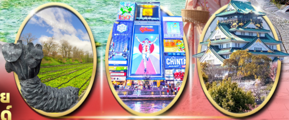
ฟาร์ม วาซาบิ ไดโอะ ซอปปิง ซินโซบาสึ ปราสาทโอซาก้า