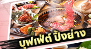
บุฟเฟต์ ปังย่าง