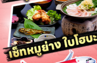
เช็กเมนูย่าง ใบโอบะ