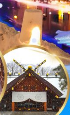
ศาลเจ้า ออกโทโต

เดินทาง 04 - 09 กุมภาพันธ์ 68 05 - 10 กุมภาพันธ์ 68