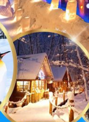
หมู่บ้านเทพนิยาย นิงเกิลทอเรส