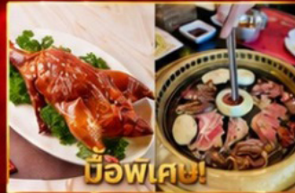
เปิดอย่างฮ่องกง บูฟเฟ่ต์ปิ้งย่างเกาหลี