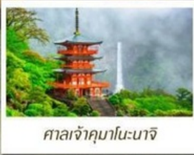
ศาลเจ้าคามาโนะนาจิ