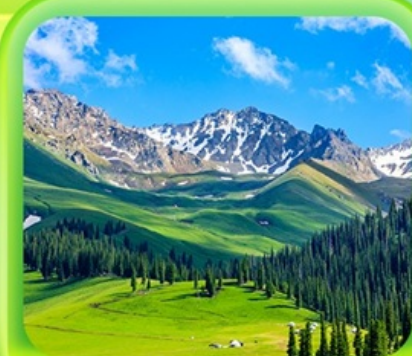
"กุ่มหญ้านาราตี"