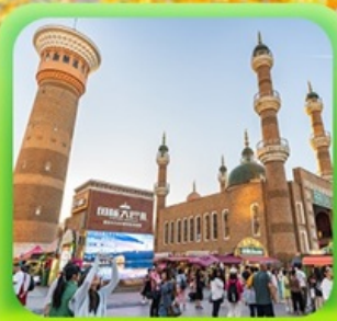
"ตลาดต้าปาจา"

ซินเจียงเหนือ ทะเลสาบโซลิมู๋ "น้ำตาหยดสุดท้ายของแอตแลนติก" • กุ่มหญ้านาราตี กุ่มดอกไม้เทียนซาน • ผ่านชมสะพานกั๋วจื่อโกว • ถนนหลิวซิงเจียง • ตลาดต้าปาจา