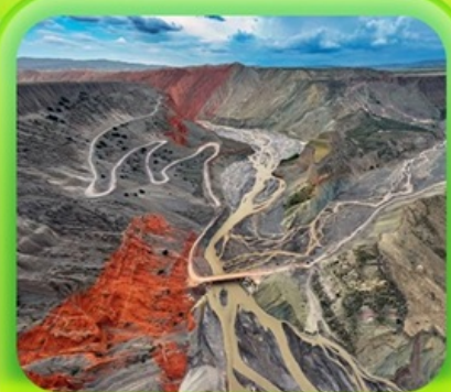
"แกรนด์แคนยอนคู่ชานโจ้ว"

ซินเจียงเหนือ ทะเลสาบโซลิมู๋ "น้ำตาหยดสุดท้ายของแอตแลนติก" • กุ่มหญ้านาราตี กุ่มดอกไม้เทียนซาน • ผ่านชมสะพานกั๋วจื่อโกว • ถนนหลิวซิงเจียง • ตลาดต้าปาจา