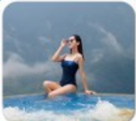
"พัก 4 اتاق PISTACHIO HOTEL"