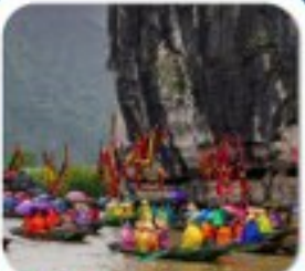
"ล่องเรือจ้างอาน"