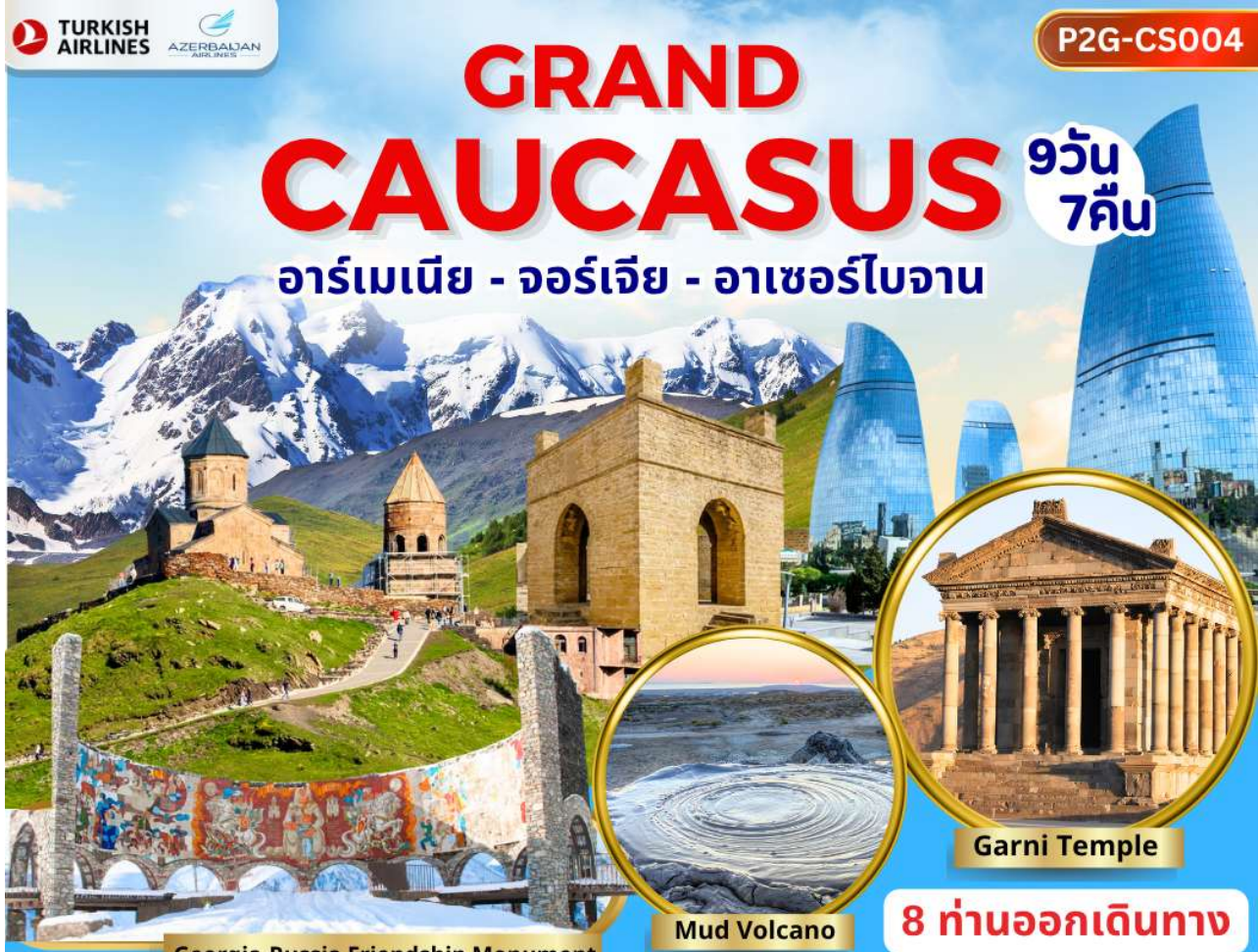
Georgia-Russia Friendship Monument