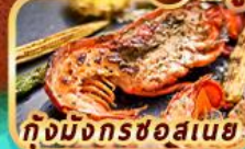
กุ้งมังกรชอสนอย