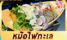
หม้อไฟทะเล