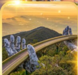
สะพานมือยักษ์

ดานัง ฮอยอัน บานาฮิลล์ เที่ยวบานาฮิลล์เต็มวัน รวมบัตรเครื่องเล่น