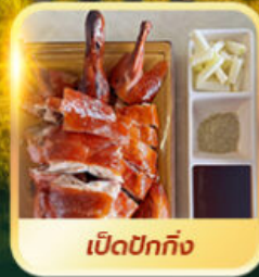
เปิดปีกถึง