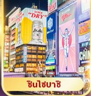
ชินไซบาชิ