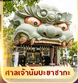
ศาลเจ้านัมมะยาซากะ